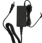
連結型充電器用 ACアダプタ SK-P58