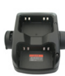
2 連連結充電器 SK-P57