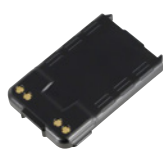
電池パックS (1200mAh) SK-P51