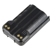
電池パックL (3350mAh) SK-P53