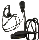
小型タイピンマイク&イヤホン SK-M53