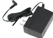
★充電器用ACアダプタ SK-P55