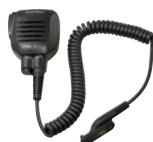
防水スピーカーマイク SK-M52 別売: SK-M52用イヤホンSK-E51