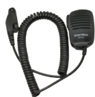
小型スピーカーマイク SK-M51

※運転中のイヤホン、ヘッドホンの装着は各都道府県の条例で規制されている場合があります